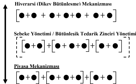
Şekil-1: Ekonomik Faaliyetlerin Yönetim Yapısı

Not: köşeli parantezler [ ] firma sınırlarını, kesikli köşeli parantez şebeke organizasyonunun sınırlarını göstermektedir.